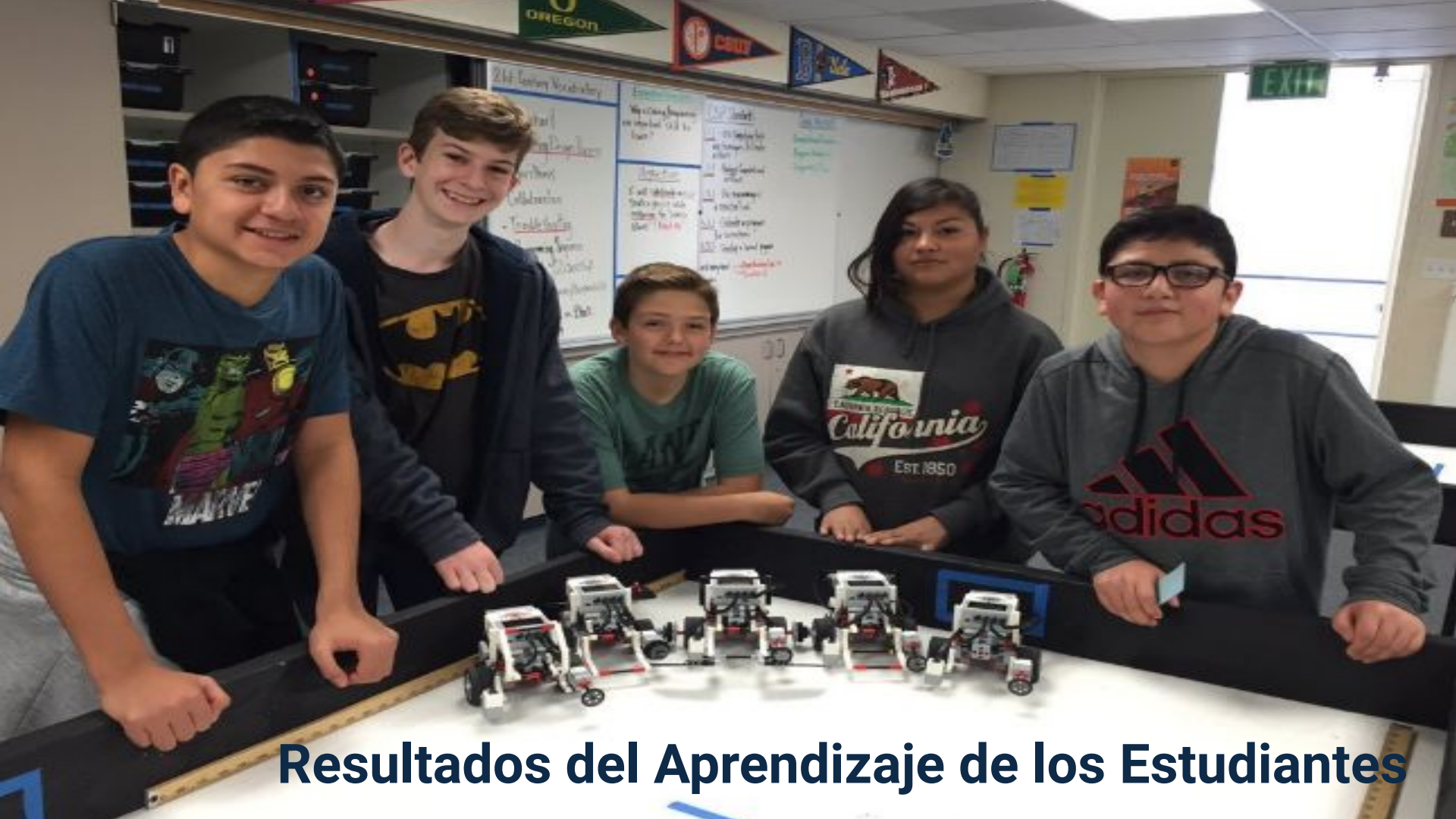
Resultados del Aprendizaje de los Estudiantes